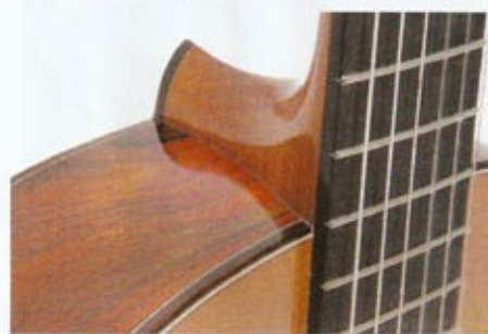
Le palissandre de Rio, visible ici sur les éclisses, et sa teinte rouge feu.

on peut le trouver sur les guitares folks et électriques – n'y est peut-être pas pour rien, l'exécution des barrés est d'ailleurs particulièrement aisée. À noter qu'une 20 e case, qui débord légèrement sur l'ouverture, est accessible sur les 1 re et 2 e cordes, permettant l'accès à un do 5 .