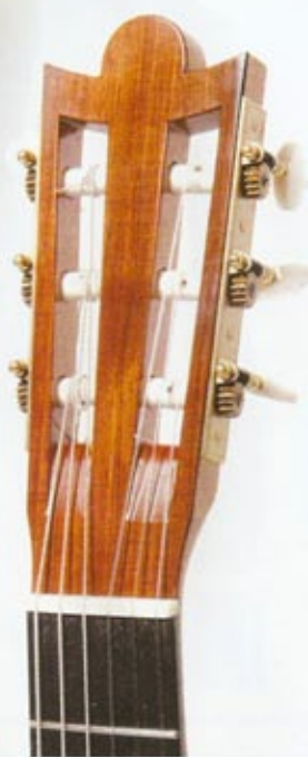
La tête est équipée de mécaniques anglaises Rodgers.

semblent éclairer celui qui le contemple. Si les lignes de l'instrument résultent de « la superposition des gabarits de Torres, Smallman et Dammann », explique Gabriel Martin, l'influence du travail de Panormo est notoire sur le plan esthétique. Ainsi la forme de tête est-elle inspirée du modèle concave du feu maître londonien, avec l'ajout d'un demi-cercle, telle une auréole, en son centre ; et la rosace est une copie de l'ouvrage anglais, à la différence près que le motif central est constitué d'une simple bande de palissandre de Rio, en écho au bois de la caisse.